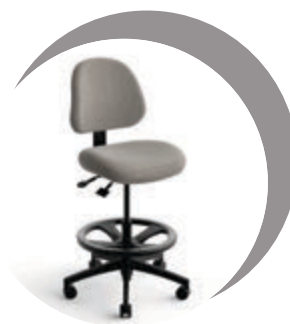
Tabouret de laboratoire FR healthHcentric