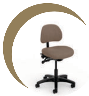
Tabouret de technicien healthHcentric

La couleur réelle du tissu peut varier par rapport aux couleurs et aux images affichées sur votre écran. Veuillez contacter votre représentant local pour commander des échantillons.