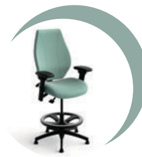
Tabouret de laboratoire airCentric H2S