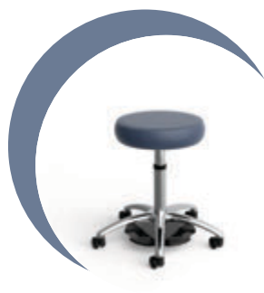
Ultime tabouret médical healthHcentric