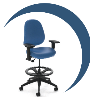
Tabouret de laboratoire FR healthCentric