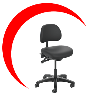
Tabouret de technicien healthCentric

La couleur réelle du tissu peut varier par rapport aux couleurs et aux images affichées sur votre écran. Veuillez contacter votre représentant local pour commander des échantillons.