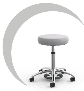
Ultime tabouret médical healthCentric