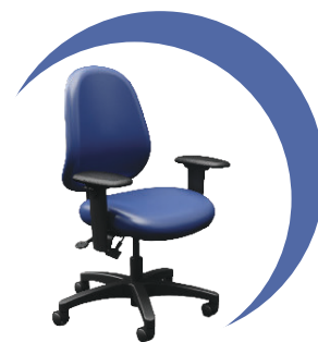
Fauteuil poste de garde nurseCentric